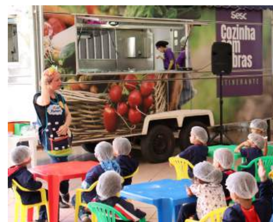
Cozinha sem sobras